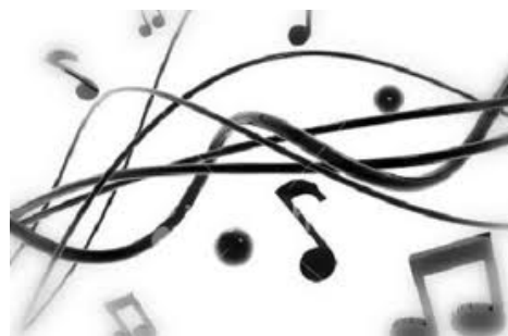
A koncerten közreműködnek

A koncert bevételét a Kaszap István Katolikus Ifjúsági- és Szabadidőközpont üzemeltetéséhez szükséges berendezésekre fordítjuk.